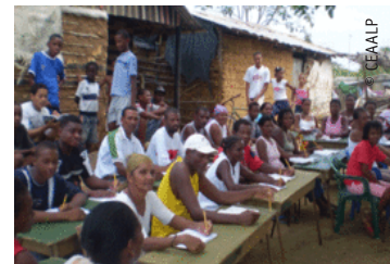
A paso lento . Page intérieure

Une publication intitulée A paso lento (À petite allure) a été produite par le Conseil d'éducation populaire en Amérique latine et aux Caraïbes (CEAAL). Cet ouvrage est tiré de 24 des 141 rapports nationaux CONFINTEA élaborés par les États membres en vue du second Rapport mondial sur l'apprentissage et l'éducation des adultes (GRALE II) , qui est le document central pour le recensement mondial de la procédure de suivi CONFINTEA. Tous ces rapports sont disponibles sur le portail CONFINTEA de l'UIL.