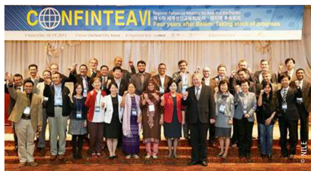
Participants de la réunion régionale de suivi de la CONFINTEA VI pour l'Asie et le Pacifique

À l'issue de la réunion, une visite à l'exposition nationale sur l'apprentissage tout au long de la vie, qui a attiré plus de 370 000 visiteurs dans l'objectif d'instaurer au sein du pays une culture vivante de l'apprentissage, a consolidé la position de l'éducation des adultes dans la perspective de l'apprentissage tout au long de la vie.