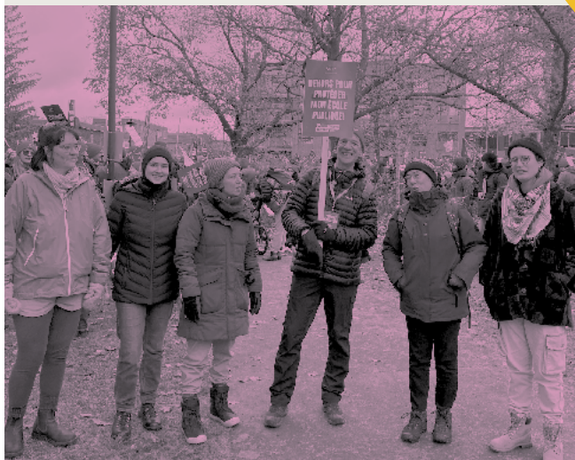
L'équipe venue soutenir la grève du milieu enseignant