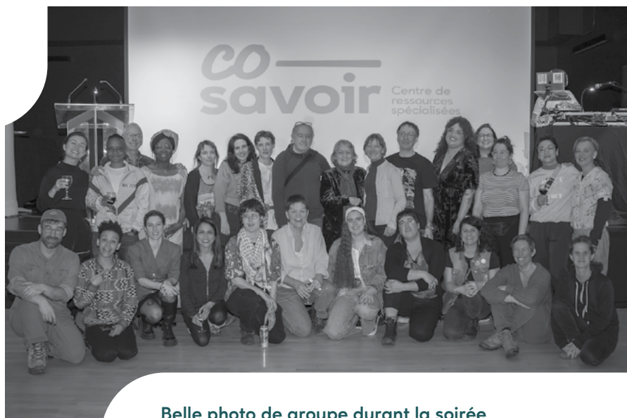
Belle photo de groupe durant la soirée de notre 40 e anniversaire

Nous avons célébré nos 40 ans cette année – quatre décennies dédiées à l’alphabétisation populaire, à l’éducation et à la formation des adultes, à la condition des femmes et à la justice numérique.